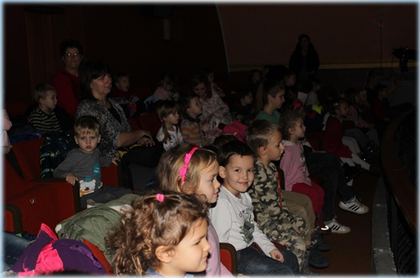
Ogled predstave veselo pričakovanje