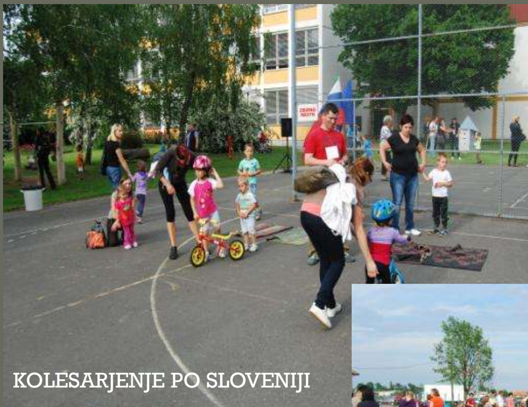
KOLESARJENJE PO SLOVENIJI